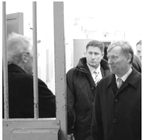
Bundespräsident Köhler mit dem Besucherreferenten Dieter von Wichmann im Rundgang.