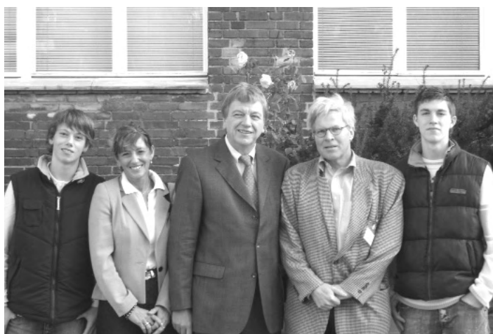
Familie Bouffier nach der Führung durch die Gedenkstätte.

Ende Oktober besuchte der Hessische Innenminister Volker Bouffier, MdL, zusammen mit seiner Familie die Gedenkstätte. Das FV-Mitglied hatte sich erst im Februar über das frühere Stasi-Gefängnis informiert und war damals spontan Mitglied des Vereins geworden. Seitdem gehört die Zukunft der Gedenkstätte zum festen Bestandteil seiner Arbeit (jök).