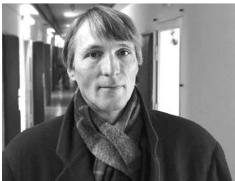
Gedenkstättenleiter Dr. Hubertus Knabe

■ Die Stasiopfer-Gedenkstätte Berlin-Hohenschönhausen hat im Jahr 2007 mit 208 000 Gästen einen neuen Besucherrekord erzielt. Direktor Hubertus Knabe führt das weiter steigende Besucherinteresse darauf zurück, dass das einstige Gefängnis wie kaum ein anderer Ort in Deutschland die bedrückende Atmosphäre der SED-