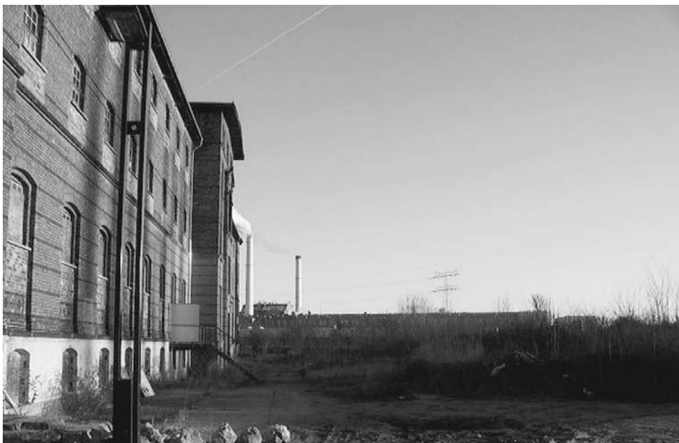
Haus VI des früheren Gefängnisses (2008).