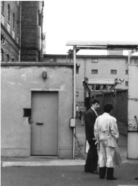
Eingangsbereich Haus VI (1990).

Anstalt erwarb die Maruhn-Immobilien- .gruppe, die hier 26 Millionen Euro in den Umbau der Gebäude zu einem Wohnpark investiert. Die Arbeiten hier- zu haben am 1. April 2007 begonnen. Inzwischen wohnen die ersten Eigen- tümer und Mieter in den früheren Gefängnisgebäuden. Die Arbeiten auf dem Areal werden voraussichtlich in einem Jahr abgeschlossen sein. Dann