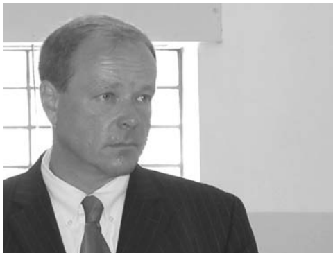
Dirk Niebel, MdB, bei einem Besuch in der Gedenkstätte im August 2007.