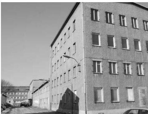
„Lager X“ (Blick Richtung Genslerstraße).

Das „Lager X“, unmittelbar neben der Gedenkstätte Berlin-Hohenschönhausen gelegen, ist offenbar vom Abriss bedroht. Dort unterhielt das Ministerium für Staatssicherheit von 1952 bis 1974 ein Zwangsarbeitslager, in dem etwa 8 000 Menschen gefangen gehalten wurden. Eingesetzt wurden die bereits verurteilten Häftlinge bei Bauarbeiten und in lagereigenen Werkstätten. „Hier wurden