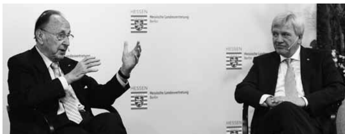
Der frühere Bundesaußenminister Hans-Dietrich Genscher und Hessens Ministerpräsident Volker Bouffier im Gespräch

Ende November ist im Berliner Regierungsviertel die Veranstaltungsreihe „Hessen erinnert – 50 Jahre Mauerbau“ ( www.hessen-erinnert.de ) zu Ende gegangen, die trotz eines thematischen Überangebots zwischen Kanzleramt und Bundesrat auf ungewöhnlich große Resonanz gestoßen ist.