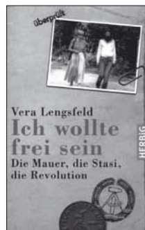
Vera Lengsfeld: Ich wollte frei sein. Die Mauer, die Stasi, die Revolution. Herbig Verlag München 2011. 352 Seiten, 19,99 Euro