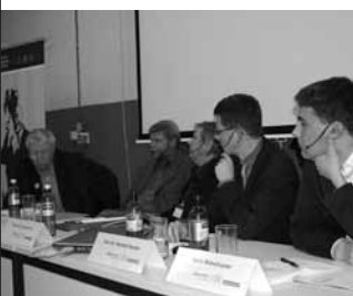
Engagierte Diskussionen in verschiedenen Foren