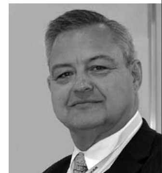
FV-Gründungsmitglied Holger Krestel (MdB)