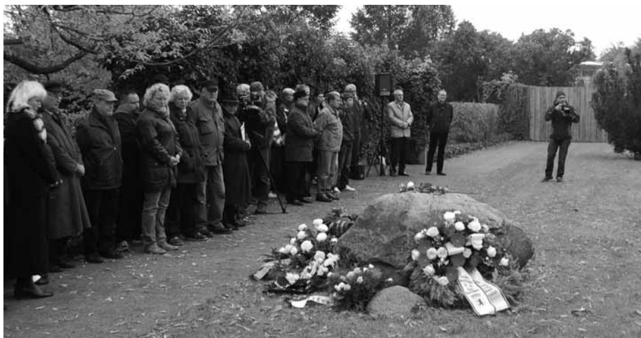
Gedenken auf dem Friedhof Berlin-Hohenschönhausen

Wer kennt heute noch die Abkürzung NKWD und die grauenhaften Verbrechen gegen die Menschlichkeit, für die diese Abkürzung steht? Zu wenige, viel zu wenige! Wer denkt noch an das Leiden und Sterben der Opfer des berüchtigten Befehls 00315 der Sowjets, der vom Ende des 2. Weltkrieges an zu willkürlichen Internierungen unter menschenverachtenden Haftbedingungen führte? Zu wenige, viel zu wenige! Einige dieser Wenigen fanden sich am Vormittag des 24. Oktober 2011 auf dem kleinen Friedhof Hohenschönhausen an der Gärtnerstraße in Berlin ein. Dort gibt es den „DENKORT“, ein Mahnmal für die Menschen, die im Speziallager Nr. 3 des Volkskommissariats für Innere Angelegenheiten, des NKWD, der UdSSR ihr Leben ließen. Hier wurde