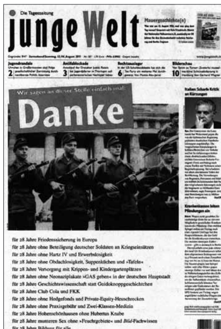
Titelbild der „Jungen Welt“ – aggressiv und diffamierend

Mit einer geschmacklosen Provokation hat die linksradikale Tageszeitung „Junge Welt“ (JW) zum 50. Jahrestag des Mauerbaus auf sich aufmerksam gemacht. Das Blatt hatte am 13. August über einem Foto bewaffneter Kampfgruppenangehöriger vor dem Brandenburger Tor gedruckt: „Wir sagen an dieser Stelle einfach mal: Danke“.