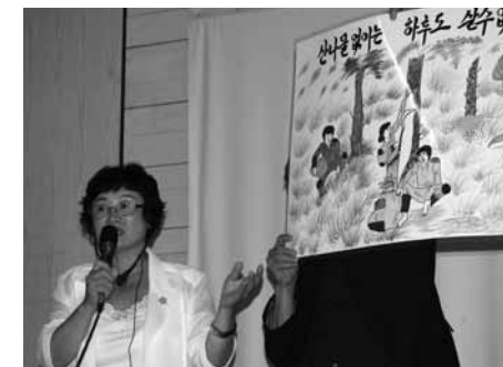
Zeichnungen früherer Lagerinsassen illustrieren ihr Elend