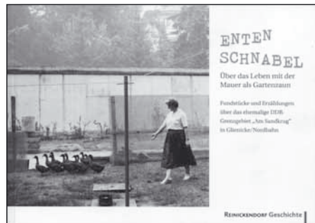
Entenschnabel. Über das Leben mit der Mauer als Gartenzaun. Herausgegeben vom Bezirksamt Berlin-Reinickendorf. Alt Hermsdorf 35, 13467 Berlin. 98 Seiten, 3,50 Euro

Selten sind die Folgen der deutschen Teilung so nachdrücklich und unaufdringlich dargestellt worden wie in dieser gut lesbaren Broschüre. Ein Volltreffer. ■