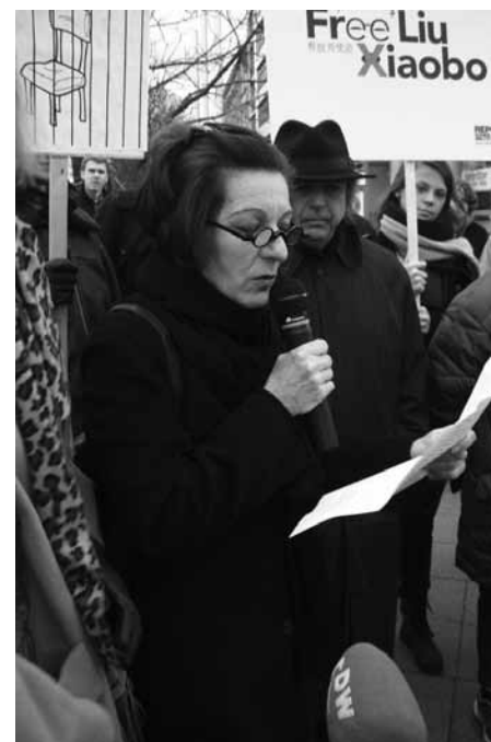
Literaturnobelpreisträgerin Herta Müller vor der chinesischen Botschaft in Berlin

In Berlin beteiligte sich Literaturnobelpreisträgerin Herta Müller an der Aktion. „Das Regime behandelt Xiaobo schä-