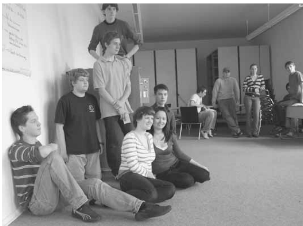
Die letzte Vorbereitung vor der Präsentation.

Schulprofile erhalten. Hierzu zählt auch, sich für besondere Unterrichtsinhalte und Unterrichtsformen entscheiden zu können. Es steht also zu erwarten, dass es nicht bei einem Zehlendorfer Gymnasium bleiben wird, dass Projekte oder Projektwochen in das Schulprogramm aufnimmt. Die Nachfrage dürfte also steigen und die Pädagogische Arbeitsstelle in der Gedenkstätte wollte