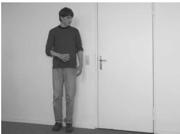
Die Angst vor dem Öffnen der Tür.

Dreigliedrigkeit vorgesehen, die, je nach vorhandener Zeit, entsprechend ausgestaltet werden kann. Als erster Schritt wird die historische Wirklichkeit in der Gedenkstätte mit Hilfe unserer Zeitzeugen erarbeitet, der zweite Schritt ist die Analyse des Films und das Verdeutlichen der Differenzen zur Realität, zum Schluss, je nach Zeit, können daraus alternative Szenenvorschläge erarbeitet