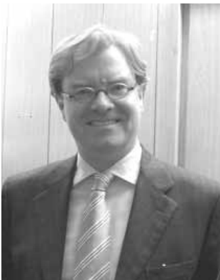
Kulturstaatssekretär André Schmitz.

■ Der Berliner Senat und die Bundesregierung wollen die Gedenkstätte ausbauen. Für den Umbau einer ehemaligen Lagerhalle zu einer Ausstellungsfläche sind 16,2 Millionen Euro bewilligt worden. Von dem Geld sollen auch eine Cafeteria, ein Foyer, ein Museumsgeschäft sowie Räumlichkeiten für Bibliothek, Archive und Veranstaltungen geschaffen werden. Die Mittel sind bereits in die Haushaltsentwürfe eingestellt worden, die aber noch von den Parlamenten verabschiedet werden müssen. Berlins Staatssekretär für Kultur, André Schmitz (SPD): „Mir liegt die Gedenkstätte Berlin-Hohenschönhausen sehr am Herzen. Sie ist inzwischen einer der wichtigsten Orte in Deutschland, an dem über das Unrecht in der DDR informiert wird“.